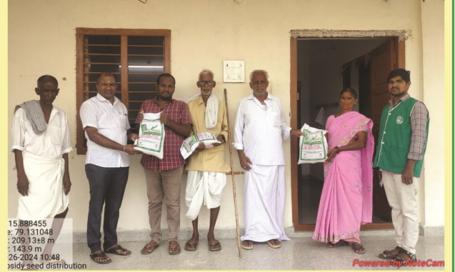
15.888455 8.79.131048 209.1329 m 143.9 m 26-2024 10.48 xside seed distribution